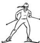
Ski de Fond