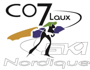
Boucle bleue 2.5 km